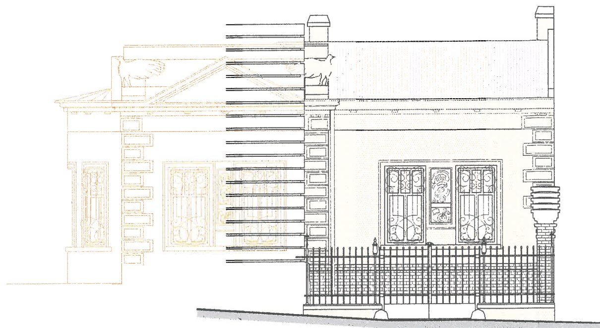
CELKOVÝ POHLED ČELNÍ